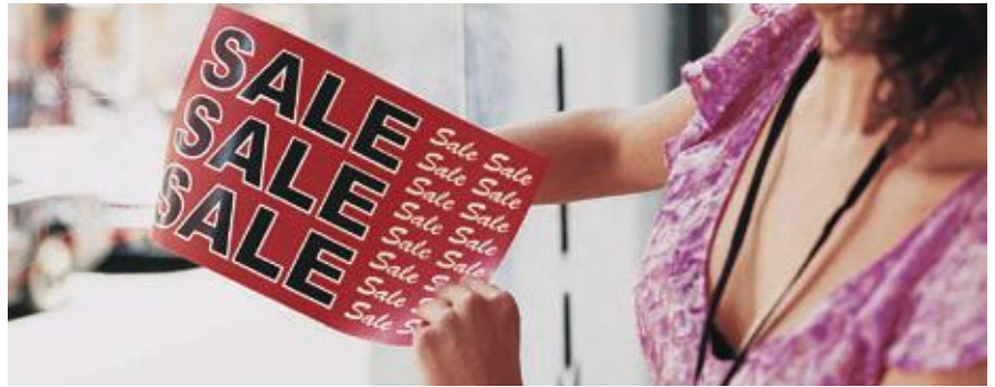
Xerox® NeverTear raamposters

Onze speciale polyester EA low-meltoner versmelt de uitvoer met de kunststof door middel van een eigen chemisch bindingsproces voor een verbluffende beeldkwaliteit op speciale substraten waaronder kunststof en nog veel meer. Onze EA-toner, inclusief Premium NeverTear, is water-, olie-, vet- en scheurbestendig.